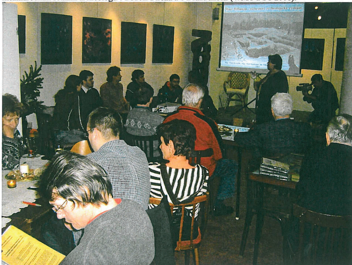
Obr.1: Přednáška Archaie Olomouc o.p.s. ve Starém Bohumínu pro místní občanské sdružení.

Z dalších aktivit nutno vyzdvihnout aktivní pořadatelskou účast členů společnosti na mezinárodním setkání archeologů v Podolí u Brna a v Drážďanech (WMC a SC 2008).