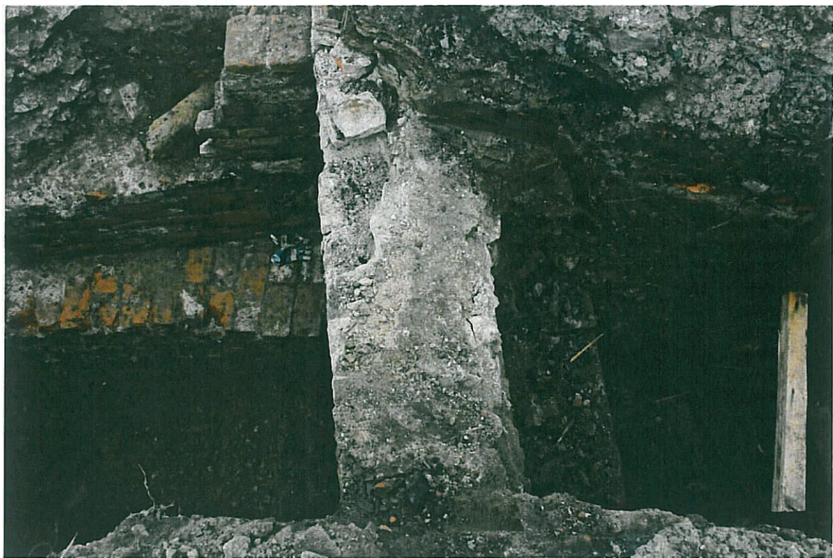
Obr. 3: Olomouc. Sonda S20 – pohled na vnější a vnitřní dispozici fortifikace